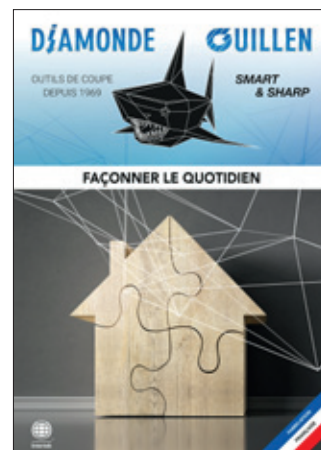
Façonner le quotidien

Depuis plusieurs décennies, nous nous efforçons d'être le maillon indispensable entre vos idées et vos produits.