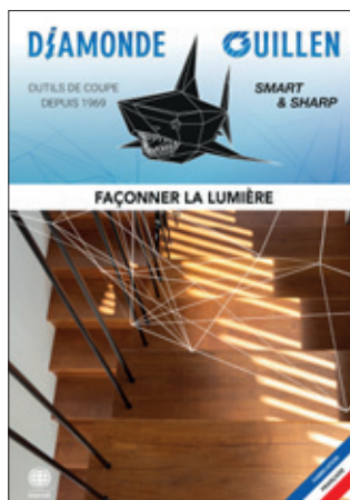
Façonner la lumière