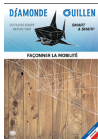
Façonner la mobilité