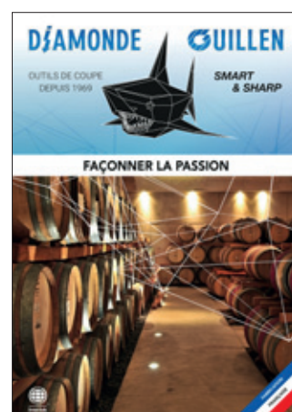
Façonner la passion